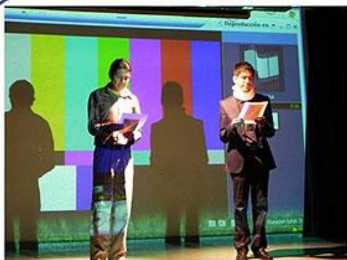
Entrega de reconocimientos a participantes Por Christian Morales y Donnovan Santo Organizadores del ENAEA2010