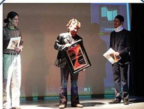
Reconocimiento joven artista 2010 Canelo Kot Cantautor y actor